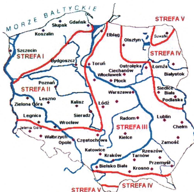
Rys. 1 Strefy klimatyczne Polski i temperatury obliczeniowe

Położenie obiektu, w którym planowany jest montaż, na mapie ma wpływ na pracę instalacji oraz na dobór mocy projektowanego kotła. W zależności od współrzędnych geograficznych rozbieżności w temperaturach projektowych mogą mieć znaczącą wartość i wpływ na zapotrzebowane na ciepło w budynku. W skali kraju ilustruje to poniższa mapa (Rys.1).